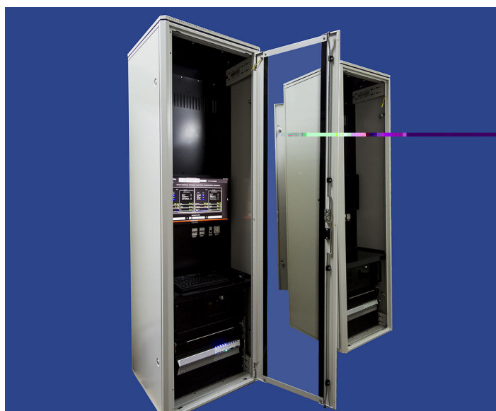
Шкафы ШАРМ СУМ

Шкаф обеспечивает оператора основной диагностической информацией о контролируемом трансформаторном оборудовании. ШАРМ СУМ содержит промышленный сервер с резервированными жесткими и твердотельными дисками, источник бесперебойного питания и человеко-машинный интерфейс. Компьютер подключен к шкафам нижнего уровня СМТО волоконно-оптической линией цифровой связи. Типовая схема СМТО может работать в автономном режиме, либо быть интегрирована в существующую АСУ ТП предприятия.