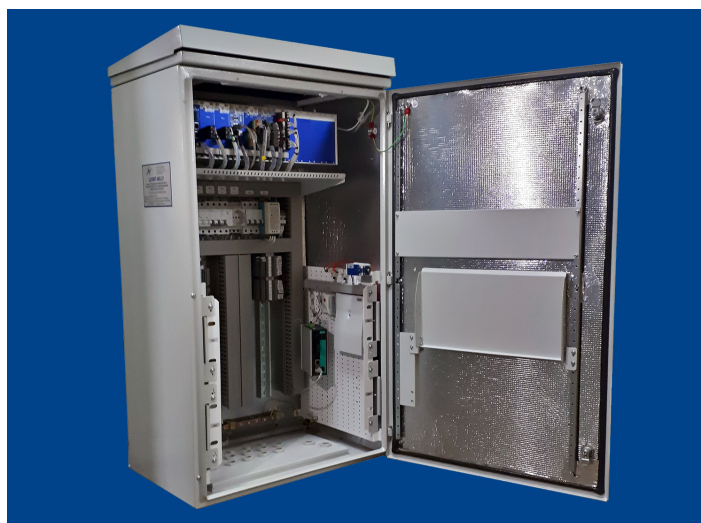
Шкаф ШУМТ-М на базе контроллера АВ-ТУК